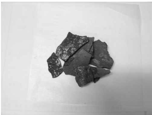
Fig. 1. Photograph of the vanadium pentoxide sample.

Fig. 1과 같은 판상 모양의 시료를 먼저 막자사발로 분쇄하고 오븐에서 건조한 다음, 바나듐 화합물을 녹이기 위하여 두 가지 방법으로 실험하였다. 첫 번째로 약 0.1 g의 시료를 Teflon PFA 재질의 비커에 넣고 왕수 16 mL와 과산화수소산 0.5 mL을 가하여 가열판 위에서 서서히 가열하여 용해시키고 실