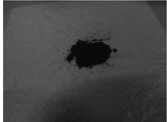
Fig. 2. Photograph of the vanadium pentoxide sample grinded.

Table 3에서 알 수 있듯이 두 가지 용해방법으로 용해한 다음 측정된 바나듐 결과는 커다란 차이가 없었다.