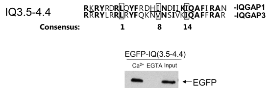
Fig. 4. CaM binding of IQ(3.5-4.4) of IQGAP3 in HEK293T cells. Alignment of amino acid sequences of IQ(3.5-4.4) motif of human IQGAP1 and mouse IQGAP3 (upper) and CaM binding of overexpressed IQ(3.5-4.4) of IQGAP3 using 3xFLAG-hCaM co-IP (lower). EGFP-IQ (3.5-4.4) showed Ca 2+ -dependent CaM binding. Bound proteins were visualized by immunoblotting using an anti-GFP antibody.

이전의 연구에서는 IQGAP1의 IQ 부위 내에 새로운 CaM 결합 부위인 IQ(2.7-3)과 IQ(3.5-4.4)를 보고 하였다. IQGAP1과는 다르게 IQGAP3의 경우 IQ3가 의미있는 CaM결합성을 보이므로, IQGAP3의 경우 IQ(2.7-3)의 경우는 연구를 수행하는 것이 의미가 없었다. 따라서, 본 연구에서는 IQGAP3의 IQ(3.5-4.4)에 대한 결합성을 조사하였다. 우선 IQGAP3에 IQ(3.5-4.4)에 해당하는 부위의 아미노산 서열을 IQGAP1과 비교해 보았다. Fig. 4에서 볼 수 있듯이 IQGAP1에 Ca 2+ -의존적 CaM 결합에 중요하다고 알려진 consensus sequence인 1-8-14 부위((FILVW)xxxxxx(FAILVW)xxxxx(FILVW))가 있는데 16 , IQGAP3의 경우도 이 부위가 보존되어 있음을 알 수 있었다(Fig. 4). 이전의 연구에서 결합성이 중요하다고 알려진 RKR서열도 RRR서열로 보존되어 있음을 알 수 있었다. 13 다음으로 이 부위를 EGFP와 결합시켜 HEK293T 세포에 발현시켜 3xFLAG-hCaM co-IP를 이용해 CaM과의 결합을 조사하였다. Fig. 4에서 보여지듯이 이 부위도 Ca 2+ -의존적 CaM 결합성이 있음을 알 수 있었다. 따라서, IQGAP1에서처럼 IQGAP3에서도 IQ(3.5-4.4) 부위가 Ca 2+ -의존적 CaM 결합 부위로 작용할 수 있음을 알 수 있었다.