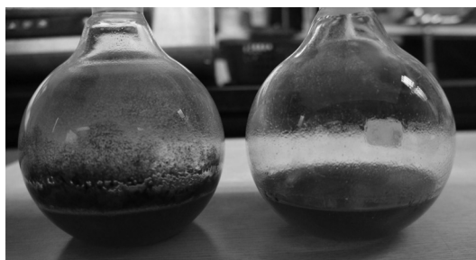
Fig. 1. Comparison of effect of solvent on extraction efficiency between methanol (left) and 95% ethanol (right).

고추로부터 capsaicinoids oleoresin을 추출하기 위하여 ethanol을 추출용매로 하여 주로 환류추출법이 이용되고 있다. 15,22 최근 Ha 등 22,23 은 고추장, 김치, 스낵 등으로부터 capsaicinoids를 신속하게 분석하는 방법을