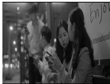
(장면 2) 5화

두 번째는 “호스트바 출신 배우와 포털사이트 임원 스폰서”(5화)라는 그녀를 둘러싼 불명확한 데이터들이 빠른 속도로 인터넷 영역을 누비며 그녀를 실검의 자리에 올린다.(장면 1) 두 번째 실검은 아무런 인풋도 없이 만들어진 아웃풋으로, 송가경의 남편인 오진우(지승현 분) 개인의 불법적인 거래에 의한 결과였다. 지극히 사적인 이유로 행해진 불법적 거래를 통해 공적 관심사인 실검이 조작됐지만, 사용자들은 이 과정을 알 수 없을 뿐 더러 진위 여부를 확인하려는 시도조차 하지 않는다. 그저 삼삼오오 모여 앉아 눈으로만 확인되는 실검 결과를 기정사실로 치부해버린다.(장면 2)