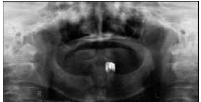
Fig. 4. Postoperative panorama view. Alveolar bone and Palate were preserved.