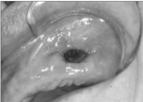
Fig. 3. Sequestrectomy at 1st approach. Limited access was done to avoid destruction of palatal bone.