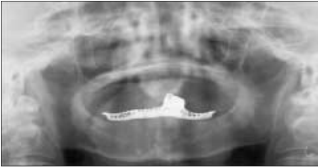
Fig. 1. Preoperative panorama view. There was no tooth and Patient needed the complete denture.