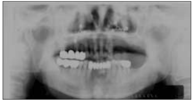
Fig. 8. Postoperative panorama view. Sequestrum was removed and separated maxilla was fixed with screw and plate.