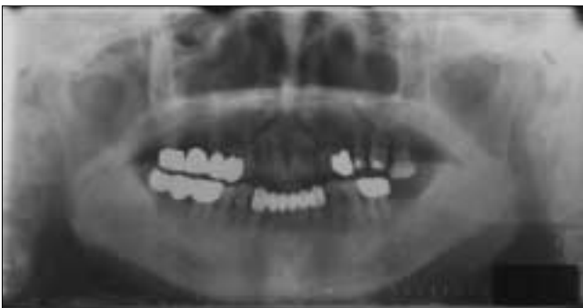
Fig. 5. Preoperative panorama view. Periodontitis was found in the Left maxillary alveolar bone.