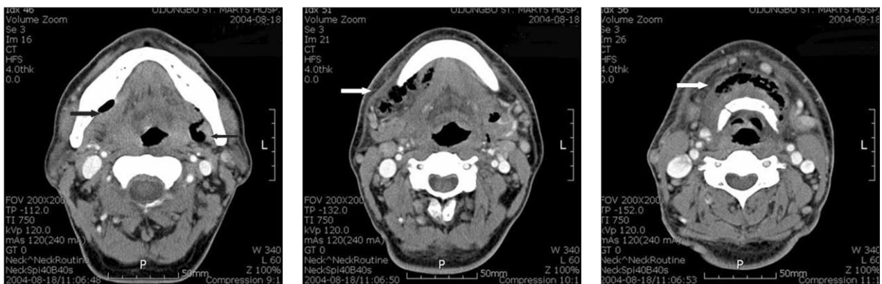
Fig. 1. CT images of Case I at pre-operative state.

Diffuse soft tissue swelling with fluid collection along the anterior neck and air bubbles in both submandibular and submental areas.