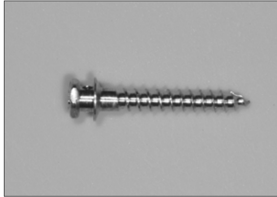
Fig. 1. Photograph of an orthodontic anchorage screw.