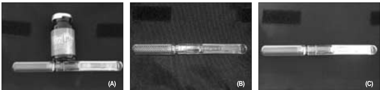
Fig. 1. (A) ViziLite® Kit is consisted of 1% acetic acid, a capsule, and a retractor. (B) Inactivated ViziLite® capsule inserted in a retractor. (C) Activated ViziLite® capsule inserted in a retractor. The capsule comprises an outer flexible plastic capsule and an inner fragile glass vial. Activation of the capsule is achieved by flexing it, wherein, the inner fragile glass vial ruptures releasing the contents. After activation, the capsule produce light of the blue-white color with a wavelength ranging from 430 to 580 nm.