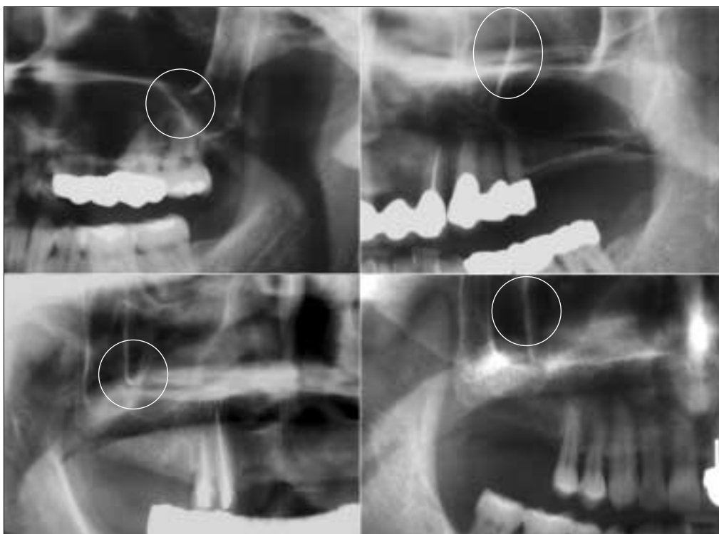
Fig. 4. Misconception for superimposed image. In the round area clear image of septa is recognized wrong by superimposed image.