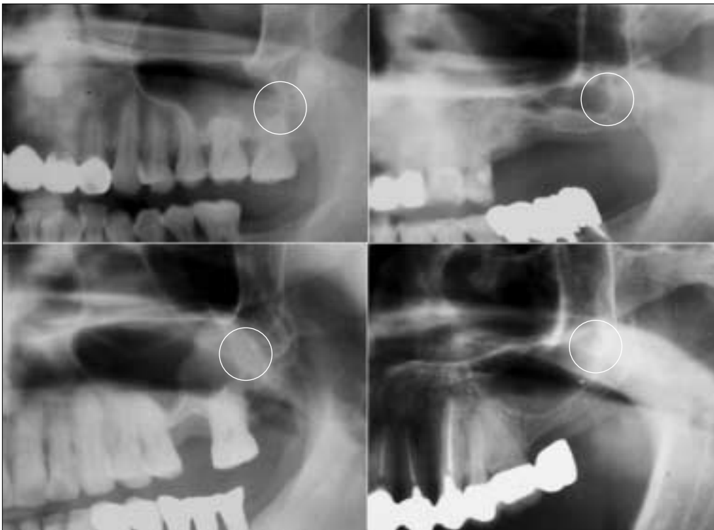
Fig. 2. Faint image(no relation to sinus lifting). In the round area faint image is in the rear of the second molar no related to sinus lifting.