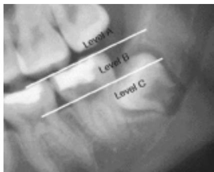
Fig. 2. Pell-Gregory's classification