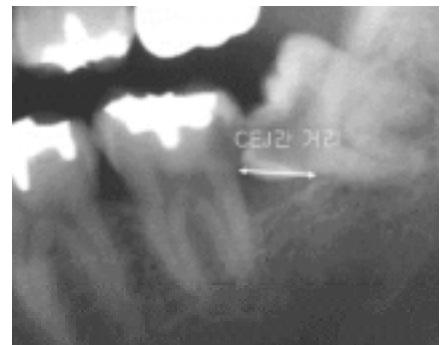
Fig. 3. Leone's classification