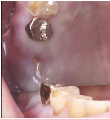
Fig.1. Pus discharge from the small soft tissue defect without oroantral fistula.