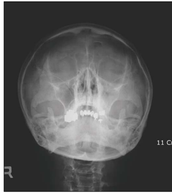
Fig.2. Cloudy haziness in the left maxillary sinus (A), and sequestration and involvement of the maxillary sinus(B) are noted.