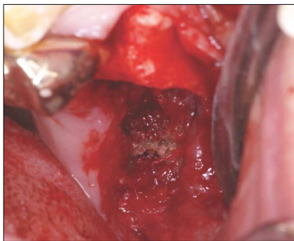
Fig.3. During sequestrectomy, several sequestra observed.

착하였다. 비교적 양호한 예후를 보이고 있으며 환자는 현재 주기적인 검사를 위해 내원하고 있다.