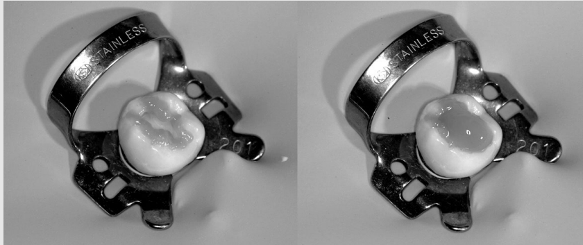
그림 4. 상아질의 과도한 산 부식을 막기 위해 법랑질을 선택적으로 먼저 부식한 후 상아질에 일시에 산 부식제를 채워준다.

을 산 부식한 법랑질 표면에 스틸 경우 금속성분이 묻어나는 것을 쉽게 볼 수 있는데 이 부분은 색이 변해 복합레진 수복에 영향을 주기 보다는 이미 부식된 표면이 망가진 것을 의미하게 된다. 보조자가 산 부식 후 수세를 할 때 치아에 석션의 끝을 대지 않도록 주의하여야 한다. 또한 상아질에서도 마찬가지로 산 부식한 표면에 타액이나 혈액이 묻는 경우 물로 다시 씻어내더라도 접착강도가 심각하게 감소하게 된다. 오염된 부분이 넓다면 표면을 약간 삭제하고 다시 산 부식을 하는 것이 올바른 방법이다.