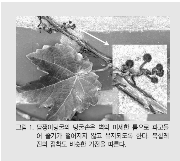
그림 1. 담쟁이덩굴의 덩굴손은 벽의 미세한 틈으로 파고들어 줄기가 떨어지지 않고 유지되도록 한다. 복합레진의 접착도 비슷한 기전을 따른다.

들도 기본적으로 이러한 기전을 이용하고 있다. 치과용 접착시스템의 발전으로 현재 우리는 과거에는 생각조차 할 수 없었던 많은 시술을 할 수 있게 되었으며 치아를 적게 삭제하면서도 심미적인 치료 결과를 이룰 수 있게 되었다. 이 장에서는 치아에 대한 치과용 접착제시스템의 접착원리에 대한 기본적인 사항을 살펴보고 최근의 변화를 알아본 뒤 적절한 사용방법에 대한 고려사항 몇 가지를 이해하고자 한다.