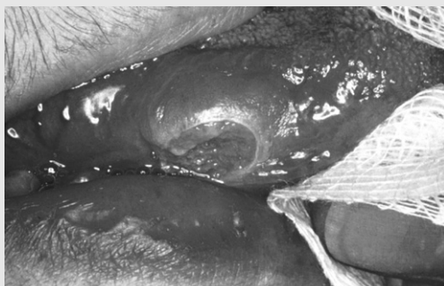
그림 1. 구강내 결핵의 임상 소견. 혀의 측면에서 만성 궤양성 병소로 관찰된다. (Oral and Maxillofacial pathology, Neville et al 9 에서 인용)