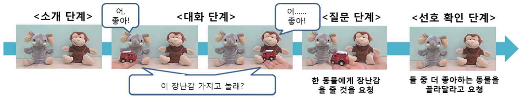
그림 2. 실험 절차의 예

차례로 이 장난감을 가지고 싶은지 물어보았다(예, 코끼리아, 기린 인형 가질래?). 한 동물은 물음에 대해 좋아한다고 답하였고(좋아), 다른 동물은 싫어한다고 대답하였다(싫어). 동물들의 대답을 다 듣고 난 후, 실험자는 아동에게 어떤 동물에게 이 장난감을 선물로 줄 것인지 물어보았다. 아동이 주기를 망설여 하거나 싫어한다고 답 한 동물을 선택한 경우에는 장난감을 좋아하는 동물에게 선물로 줄 것을 부탁하였다. 아동이 장난감을 좋아하는 동물에게 주고 나면, 긍정적인 피드백을 주었다. 첫 번째 시행에서 피드백을 받은 이후에도 아동이 두 번째 시행에서 장난감을 싫어한다고 답한 동물에게 준 경우에는 과제를 이해하지 못한 것으로 판단하여 검사 시행을 실시하지 않고 분석에서 제외하였다.