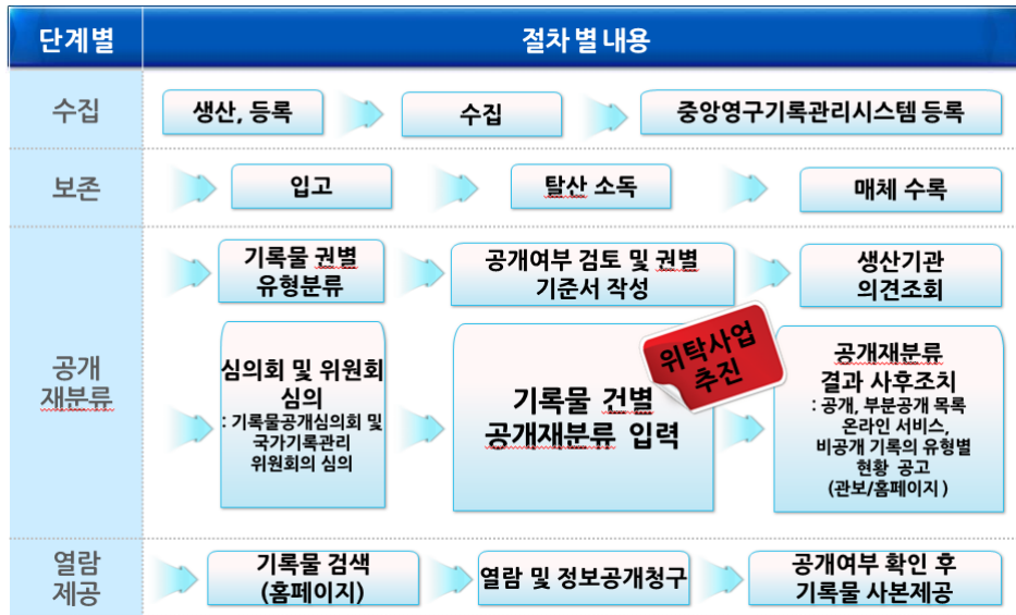
〈그림 1〉 국가기록원의 비공개기록물 공개재분류 절차 ※ 20년 비공개기록물 공개재분류 결과 건별 입력 위탁사업 착수보고자료