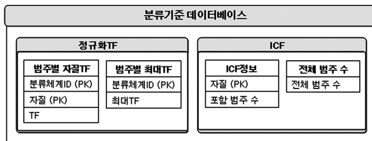
〈그림 2〉 분류기준 데이터베이스 스키마

분류기준 데이터베이스 구축 과정에서의 Input과 Output, 알고리즘은 〈표 8〉과 같다. 단계 3 수행결과인 자질리스트를 입력받아 데이터베이스를 구축한 결과 예를 〈표 9〉에 표시했다. 그동안 분류체계ID가 '050302', 분류체계명이 '10개 혁신도시 건설 추진'인 하나의 범주에 대해서만 예를 들어왔는데, 분류단계 때 비교설명을 위해 분류체계ID가 '010503', 분류체계명이 '경력 개발 프로그램 지원'인 범주를 하나 더 추가한 후, 그동안 진행했던 단계를 거쳐 분류기준 데이터베이스로 구축한 예를 〈표 9〉에 포함했다.