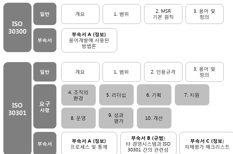
〈그림 3〉 MSR 30300 및 30301 세부구성(류가현 2011)

MSR의 원리는 “ISO 9000 – 품질경영시스템 – 기본사항 및 용어(ISO 9000:2005 Quality management system – Fundamentals and vocabulary)”에 수록된 품질경영 원리와 유사한데 그 내용으로는 고객중심, 리더십과 설명책