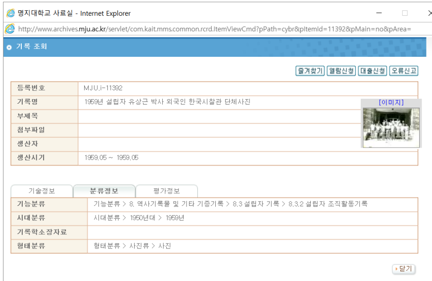
<그림 2> 설립자 기록 검색 결과 화면 예시