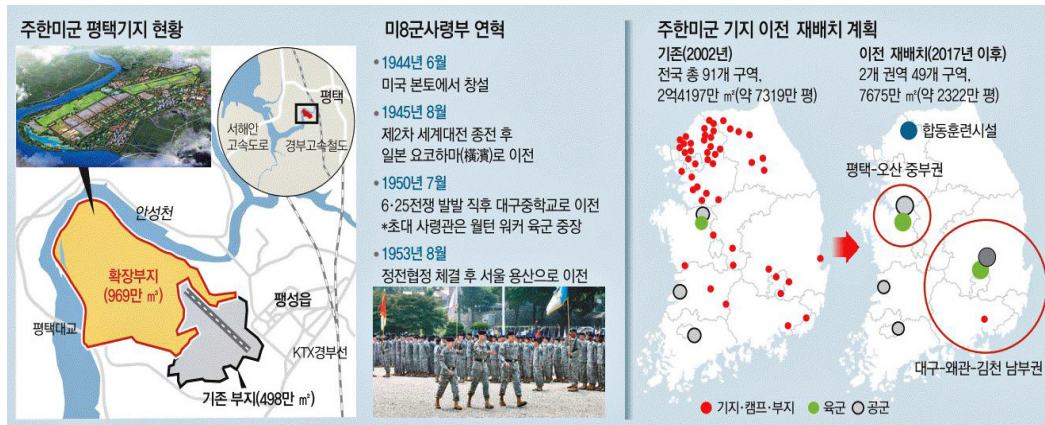
〈그림 1〉 주한미군 기지 이전 재배치 계획 1)