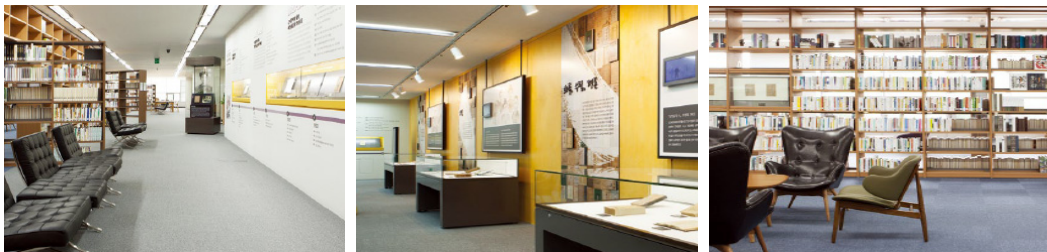
〈그림 1〉 근대문학 라키비움: 개실 당시 모습

국립한국문학관 건립은 1996년이 ‘문학의 해’로 지정됨과 함께 문학계에서 한국문학 자료를 집대성 할 기관의 필요성이 제기되면서 그 논의가 시작되었다. 이후 여러 부침을 겪다가 2015년 국립한국문학관 건립의 전초기지로서 ‘근대문학정보센터’가 국립중앙도서관 내에 설치되었다. 근대문학정보센터는 개소 이듬해인 2016년 3월 본관 2층에 위치한 문학실을 ‘근대문학 라키비움(Larchivium)’이라는 복합 문화공간으로 재단장하여 이용자들에게 공개하였다. 기존 도서관 자료실의 주 기능이었던 문학 장서 열람에 더하여, 한국 근대문학 자료를 대상으로 상설전시와 특별전시를 설치·운영하였다. 이 공간에 들어선 이용자들은 한국인이 사랑하는 시인 백석의 초상화와 100부 한정본 희귀 시집인 『시슴』을 비롯하여, 최초의 신소설 『혈의 누』부터 윤동주의 유고시집 『하늘과 바람과 별과 시』까지 흔히 교과서에서나 접할 수 있었던 한국문학사의 중요한 작품들의 초판본을 직접 눈으로 확인할 수 있었다. 이와 함께 근대문학 디지털 원문을 검색할 수 있는 것은 물론, 근대문학 연구서 등 별도의 참고도서 서가를 만들어 이용자들은 전시를 관람하면서 문학책을 읽고, 전문적인 연구 정보까지 얻을 수 있었다.