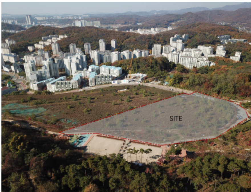
〈그림 3〉 국립한국문학관 설립 부지 전경

지원은 물론 문학인 및 문학 향유자를 위한 지원 역시 확대될 것이라는 기대가 모아졌다. 문학진흥계획의 정책적 추진을 위하여 문체부는 우선적으로 국립한국문학관 설립을 추진하였다. 문학진흥법 제18조에 의하면, 문화체육관광부 장관은 국가를 대표하는 문학관으로 국립한국문학관을 설립해야하며, 국립한국문학관은 법인으로 하되 문화체육관광부 장관이 관장을 임명하게 된다. 이에 2022년 개관을 목표로 하여 2018년 11월에는 ‘국립한국문학관 설립추진위원회’에 의해 ‘은평구(은평뉴타운 3-13BL 및 기차촌 근린공원 일원/ 19,800㎡)’로 설립 부지가 확정되었다.