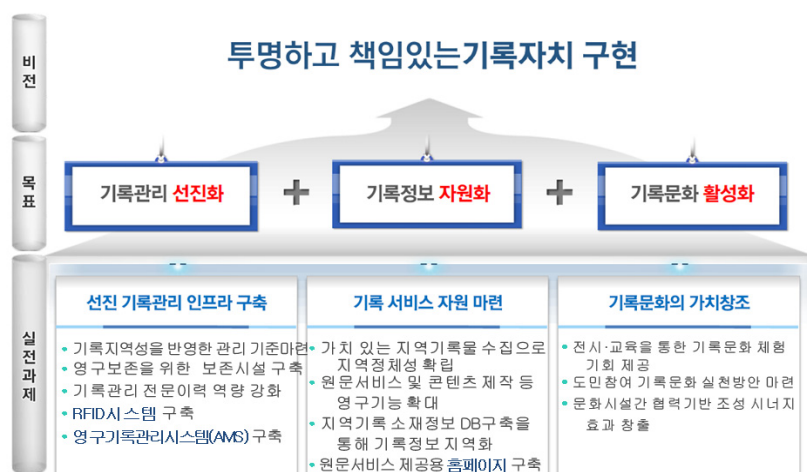
〈그림 3〉 경상남도기록원 비전(경상남도기록원 ISP 운영사업)

경상남도기록원은 경남의 공공기관에서 생산된 (생산되어야 하는) 기록을 관리하고 그것을 보다 정확·신속하게 이용할 수 있도록 하여야 하며 특히 역사적으로 보존가치 있는 기록을 평가·선별하여 후대에 길이 보존할 책임을 가지고 있다. 또한 민간기록도 함께 수집하여 경남 역사의 결락을 보완하고 보다 질적으로 우수한 기록서비스가 수행될 수 있도록 하여야 한다. 이러한 이상을 위해 경상남도기록원은 「투명하고 책임 있는 기록자치 실현」이라는 비전을 가지고 그에 따른 목표, 실천과제를 정의하였다.