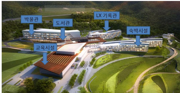
〈그림 1〉 국토정보교육원 내 LX 라키비움 조감도