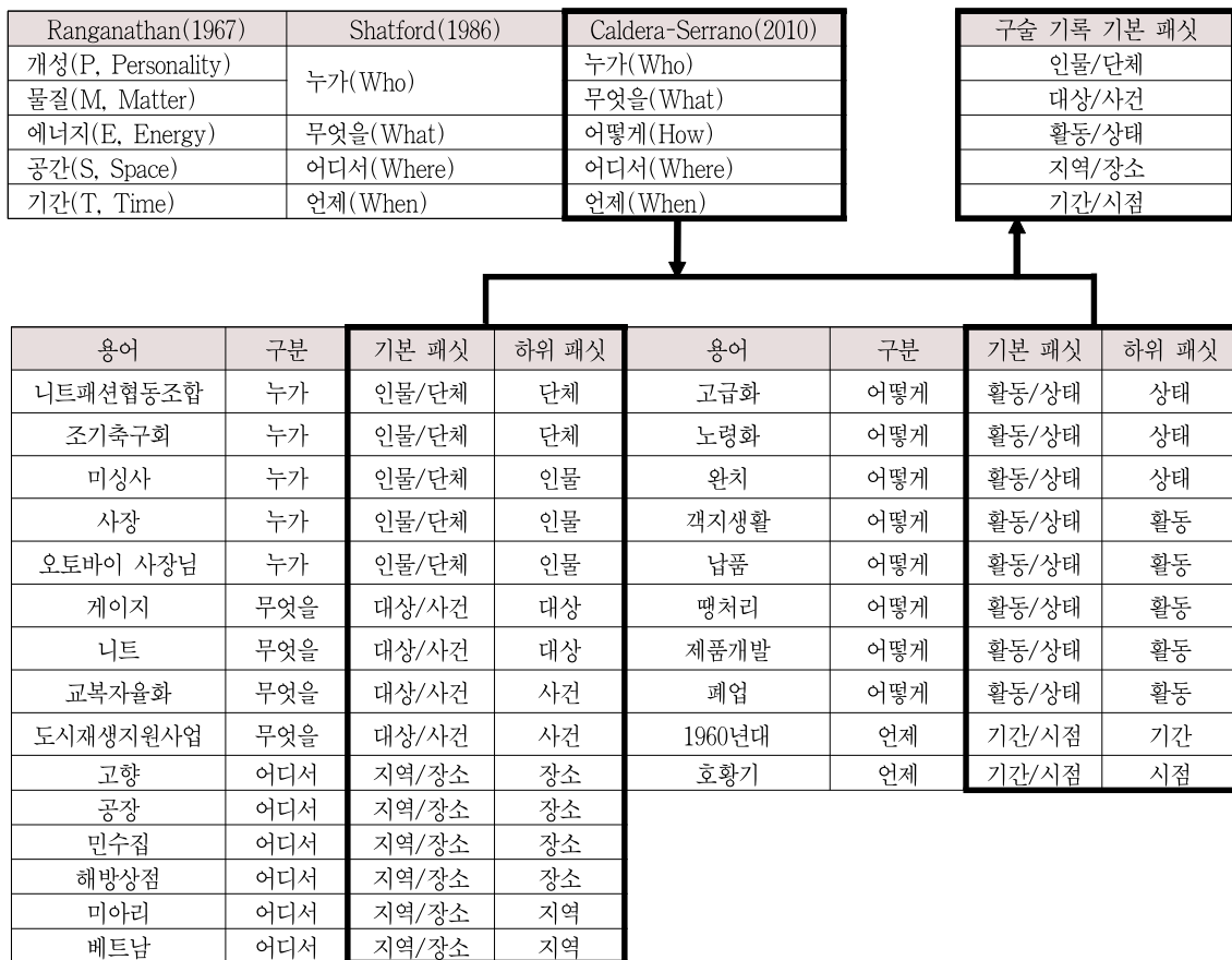
<그림 1> 구술 기록 주제명표목을 위한 패킷 설정

먼저, 추출된 용어들을 육하원칙에 따른 패킷, ‘누가, 무엇을, 어떻게, 어디서, 언제’로 구분한 뒤 각 패킷 별로 용어들을 확인하였다. 다음으로 구술 내용과 용어의 성격을 명확하게 표현할 수 있는 패킷명을 설정하였다. 이렇게 육하원칙의 패킷에 대응해서 설정된 기본 패킷은 ‘인물/단체’, ‘대상/사건’, ‘활동/상태’, ‘지역/장소’, ‘기간/시점’이다.