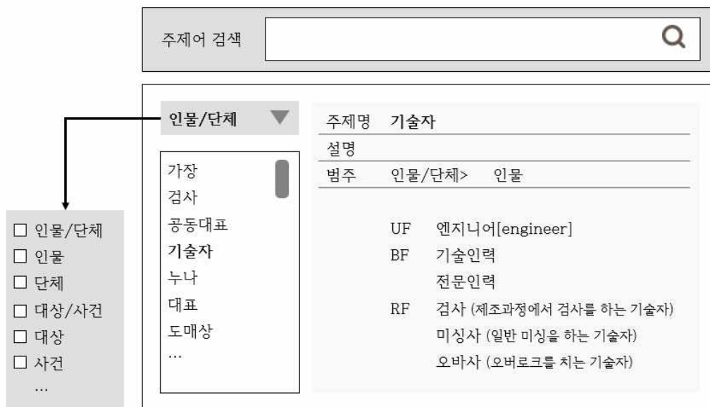
<그림 6> 주제명표목 기반 검색 화면(예시)

지금까지 해방촌 다투 사업 구술 기록의 패싯 기반 주제명표목의 개발에 대해 논하였다. 구술 기록의 내용은 정보적, 역사적, 맥락적 가치를 가진다. 따라서 구술 기록은 보존되고 관리되어야 할 뿐만 아니라 다양하게 활용되어야 하지만 그 내용에 접근하기에는 어려움이 있었다. 본 연구에서 제시한 주제명표목 개발 방식을 <그림 6>와 같이 구술 기록의 주제 접근의 도구로 활용하면 구술 내용의 서사성과 용어의 관계성을 고려한 검색을 지원할 수 있다. <그림 6>은 주제어를 패싯 기반으로 브라우징할 수 있고 선택한 주제어와 연계된 관계어를 화면에서 확인한 후 용어를 직접 선택하거나 주제어를 검색창에 입력할 수 있도록 한 패싯 기반 주제어표목의 검색 활용 방안에 대한 예시이다. 예시의 검색 화면에서는 기본 패싯 또는 하위 패싯을 선택하여 검색을 확장하거나 세분화할 수 있고 해방촌 구술 기록에서 사용된 용어가 관련어로 제시되어 구술 내용에 대한 접근이 가능하도록 하였다.