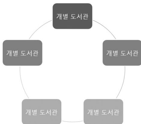
〈그림 3〉 통합대출서비스 상호대출 협약형 모형

예를 들면, A 지역 도서관의 도서관대출회원 자격은 해당 지역에 거주하거나 직장 혹은 학교에 다니는 사람으로 한정되어 있다. A 지역과 인접해 있는 B 지역에 거주하는 주민은 지리적으로 인접한 A 지역의 도서관에서 도서를 대출할 수 있는 기회가 없다. A 지역에 거주하는 주민도 이와 유사한 경우에 처해 있을 수 있다. 이를 위해 A 지역과 B 지역의 도서관이 상호대출 협약을 체결하여, 상대 도서관의 대출회원을 자관의 대출회원으로 인정하여 새로운 대출회원카드를 발급하지 않고 상대 도서관의 회원카드를 이용하여 도서를 대출해주는 서비스가 상호대출 협약형이다. 이때 상대 도서관 회원정보는 자관 이용자 데이터베이스에 저장된다.