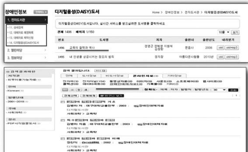
〈그림 2〉 국립중앙도서관 장애인정보 통합검색( http://able.dibrary.net )