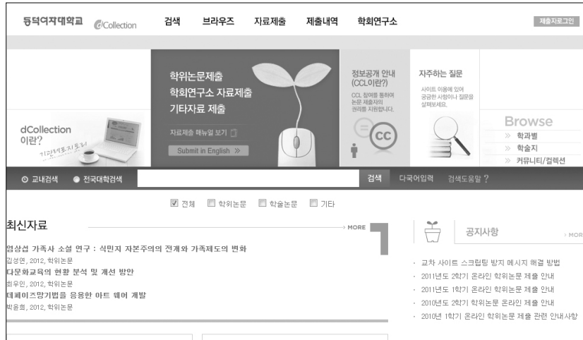
〈그림 1〉 dCollection 아카이브 페이지

는 문제점을 안고 있는 대학도서관들은 주관부서의 확립과 납본제 의무가 필요한 상태이다. 현재 국내 대학도서관들은 이와 같이 dCollection 구축 사업을 활용하여 최소한의 아카이브를 구축하고 있으며 이화여자대학교 도서관의 경우 학위논문, 부설연구소 논문집 외에 해당 대학교수들의 교외 학술지에 게재되었던 논문들을 수록하기도 한다.