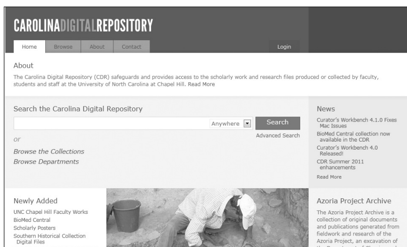
〈그림 3〉 Carolina Digital Repository(CDR) 홈페이지