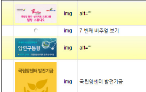
〈그림 3〉 대체텍스트 제공 오류 사례

나타났으나, 나머지 페이지에서는 1-3개의 오류가 나타나는 한편, 메인페이지에서는 9개, 그리고 진료일정 페이지에서는 11개의 오류가 나타났다. 시각 장애가 있는 이용자들이 탭으로 초점 이동을 주로 사용하는데, 초점 이동이 준수되지 않을 경우, 읽기 순서에 맞는 콘텐츠가 바로 연결되지 않아 내용 파악이 순조롭지 않게 된다. 자주하는 질문페이지의 경우, 질문항목 다음에 바로 답 항목으로 연결되지 않고, 질문이라는 대체텍스트가 두 번씩 반복되어 혼란을 주고, 효율적인 이동을 어렵게 하였다. 따라서 그러한 링크텍스트의 오류를 수정하여 이용자의 읽기를 지원하는 것이 효율적이다. 또한, 기관 소개 페이지에서는 Longdesc가 제대로 작동하지 않아 이용자가 자세한 내용을 확인할 수 있는 기회를 제공하지 못하였다.