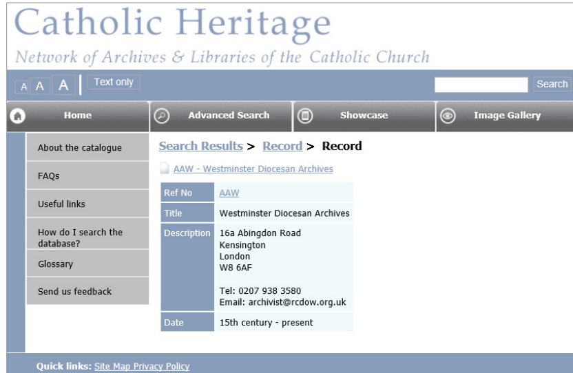
〈그림 1〉 가톨릭 헤리티지 기록물 소재지 안내

내와 시간, 해당기관에서 제공하는 기록정보서비스 등에 대해서는 적절한 정보가 제공되고 있지 못해 기초적인 소재지 정보만 제공하고 있는 수준이라고 할 수 있다.