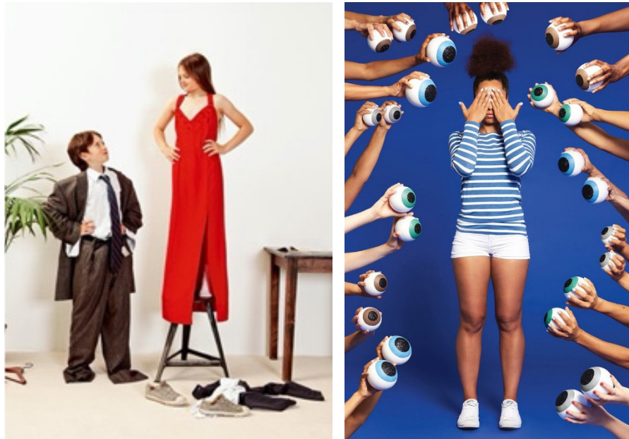
〈그림 2〉 (좌) 〈사춘기 내 몸 사용 설명서〉 (2018, 40); (우) 〈나의 첫 생리〉 (2020, 10)

다. 삽화의 비중이 큰 지식정보책에서는 책에서 다루는 거의 모든 내용이 삽화로 표현되었다. 예를 들어, 〈사춘기 처방전〉에서는 사춘기 소녀들에게 운동이 중요하다는 설명과 함께 여성 청소년이 수영하는 모습, 자전거 타는 모습, 하이킹하는 모습이 모두 삽화로 그려졌다. 〈소년들의 솔직한 몸 탐구생활〉에서는 친구와의 우정을 설명하는 글과 함께 소년 둘이 어깨동무하고 있는 모습, 손을 맞잡고 있는 모습, 소파에 드러누워 과자를 먹는 모습이 삽화 혹은 사진으로 들어갔다.