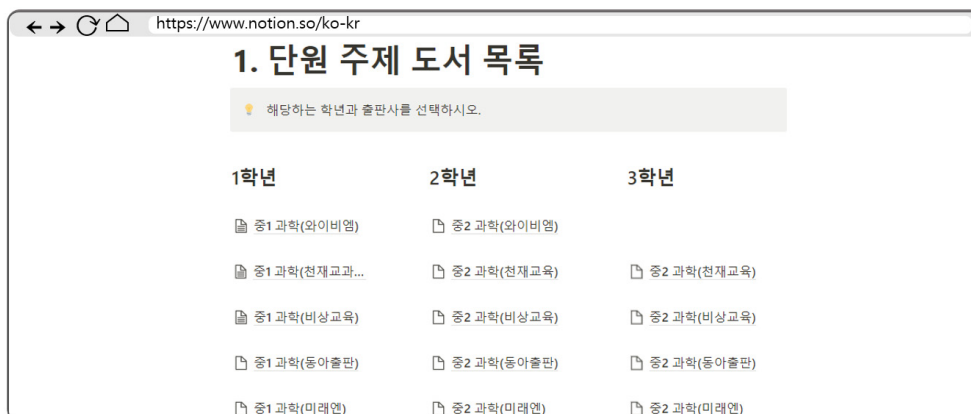
<그림 2> 단위주제 도서목록 시스템 학년 및 교과서 출판사 선택 화면

단위주제 색인 시스템은 교과 단위주제어를 사전식으로 정렬하고, 해당 주제어를 색인어로