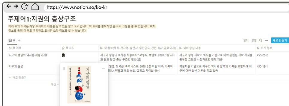
〈그림 4〉 단원의 주제어 '지권의 층상구조'와 연계된 도서목록 화면

하여 관련 도서목록 페이지로 이동하는 기능을 구현하였다. 주제 색인을 학년별, 학년 전체로 나누고 단원주제어를 한글 오름차순으로 나열하였다. 전체 학년 색인은 ㄱ(가계도 조사 방법~끓는점) 23개, ㄴ(녹는점~뉴런과 신경계의 구조와 기능) 3개, ㄷ(다양한 혼합물 분리~등속 운동) 6개로 총 32개의 색인으로 이루어져 있다.