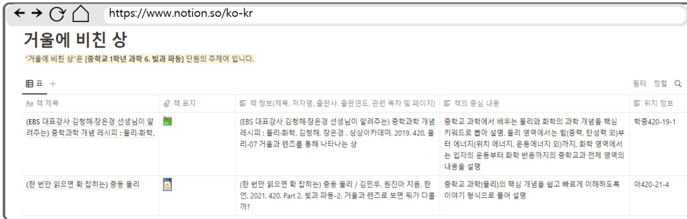
〈그림 6〉 색인 도서목록 화면(중 1학년 '6. 빛과 파동' 단원 '거울에 비친 상')

템의 연계 도서목록 페이지는 단원주제 도서목록 시스템의 목록 페이지와 구성이 거의 일치한다. 이처럼 단원주제 색인 시스템은 기존의 단원주제 도서목록 시스템이 가진 [학년 - 단원-주제어]의 순차적 이동이 아닌, 주제어에서 도서 목록으로 바로 이동할 수 있도록 하였다.