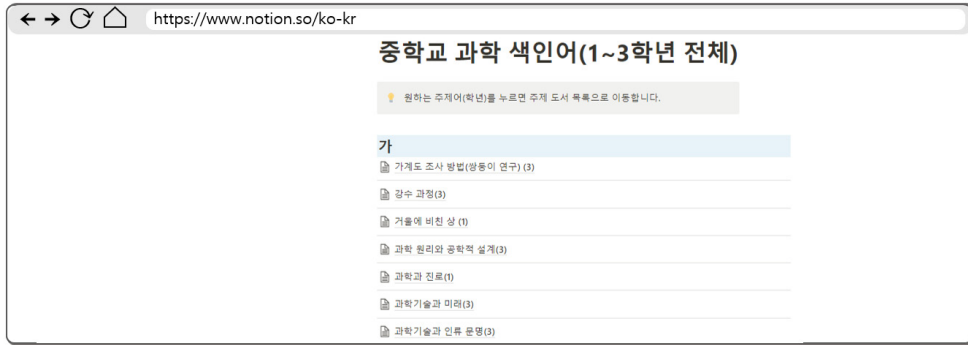
〈그림 5〉 중학교 과학 전 학년 단원주제 색인 시스템 화면