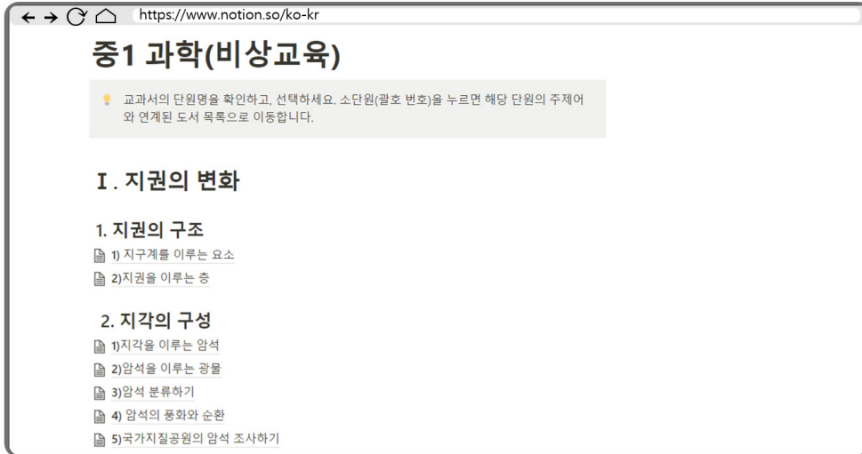
〈그림 3〉 단원주제 도서목록 시스템 교과 단원 선택 화면