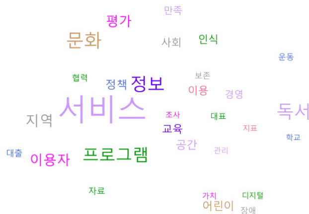
<그림 2> 워드 클라우드

더불어 '가치'와 '어린이', '디지털', '장애' 키워드 집단과 '교육'과 '공간', '조사' 키워드 집단 및 '대표'와 '경영', '관리', '지표' 키워드 집단 등