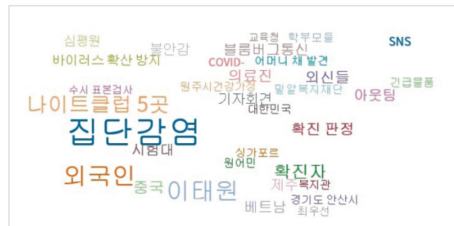
Figure 4. “코로나” 및 “이주”/“다문화”/“성소수자”/“장애”가 포함된 제목의 기사들 연관어 분석.