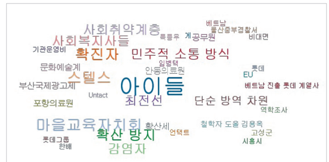
Figure 2. “코로나” 및 “공동체”가 포함된 제목의 기사들 연관어 분석.