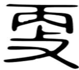
Figure 3. A image of an Ancient Chinese, meaning proceeding to.

更의 고문자 형태를 살펴보면(Figure 3) 채찍을 손에 들고 강제를 뜻하는 攴과 ‘분명하다’, ‘탁자’의 뜻을 가리키는 丙으로 이루어져 있다. 분명한 쪽으로 향하게 하더라는 뜻과 ‘새롭다’, ‘다시’의 뜻을 가리킨다. 辨病診斷體系에서는 쓰여진 단어를 병리적인 의미로 판단하므로 이와 같은 한자 의미 외에 특정 병리적인 상태를 가리킬 것으로 가정하지만 어원상으로는 글자가 무엇을 지칭하는 것인지 분명하게 밝혀지지 않았다.