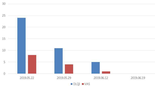
Figure 1. Changes of DLQI and VAS