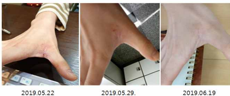
Figure 3. Pictures of clinical symptom progress