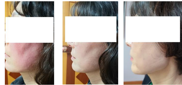
1 st day (2020. 3. 25) 8 th day (2020. 4. 1) 21 st day (2020. 4. 14) Fig. 1. Photo images of the hot flush of the Patient.