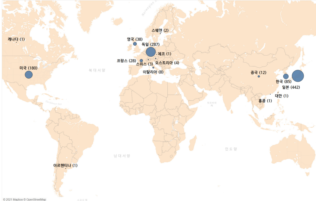
〈그림 3〉 발행국가별 참고문헌 분포