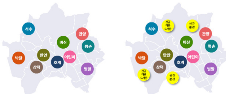
〈그림 4〉 현재 안양시 10개 공공도서관 분포(좌) 및 신규 건립 제안 지역(우)

특히 안양시 공공도서관들의 장서 포화도는 적정 장서량 대비 126% 달해 심각한 수준으로, 도서관 건립연도에 따른 장서 포화도의 불균형을 해소하고 양질의 신간도서를 지속적으로 확충하기 위해서는 문화체육관광부(2019)의 건립 운영 매뉴얼에서 제안한 장서 폐기 시점(서가 전체 장서량의 80% 충족 시점)을 고려해 도서관별로 이용가치가 상실된 자료를 적극적으로 제적·폐기할 수 있는 방안을 마련해야 한다. 이와 관련해 전체적으로 장서 수용 능력이 최대치에 달한 안양시 10개 도서관 모두가 효율적으로 장서를 관리하고 이용할 수 있도록 하는 공동 자료보존관(서고)의 건립이 필요하며, 자료보존관은 최종적으로 제적·폐기하기 전 이용가치가 낮은 자료들을 이관해 보관함과 동시에 해당 자료를 필요로 하는 이용자들을 대상으