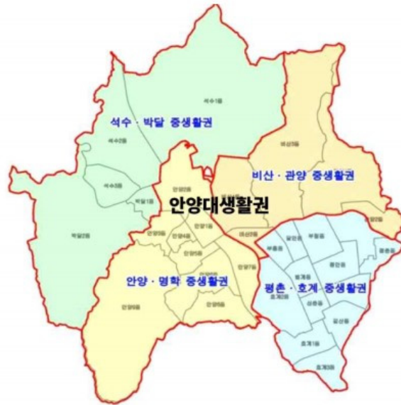
〈그림 1〉 안양시 생활권 현황 (출처: 안양시, 2017, 116)