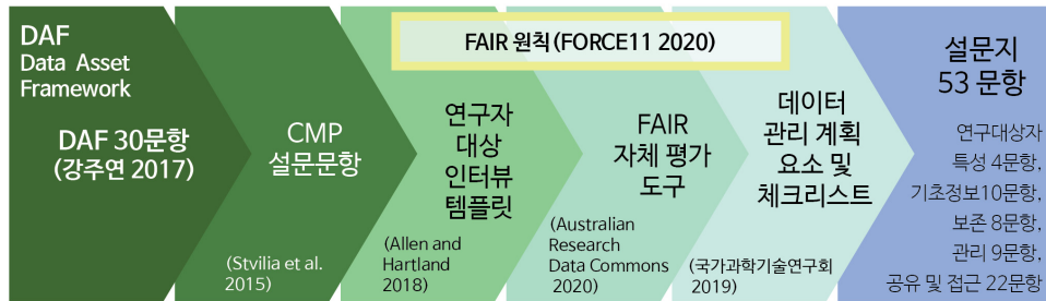
〈그림 2〉 설문지 문항 구성 단계

공유 및 접근의 3문항이다. 또한, 공유 및 접근에 FAIR 자체 평가 도구의 12문항을 추가하였고, 기존의 문항들을 보완하기 위해 FAIR 원칙을 바탕으로 4문항을 추가하였다. 그리하여 본 연구의 설문지는 연구대상자 특성 4문항, 기초정보 10문항, 연구데이터 보존 8문항, 연구데이터 관리 9문항, 연구데이터 공유 및 접근 22문항, 총 53문항으로 구성된다. 2차 설문조사 시에는 설문 응답자의 소속기관을 구별하기 위해 연구대상자 특성에 1문항을 더 추가하여 54문항으로 구성하였다.