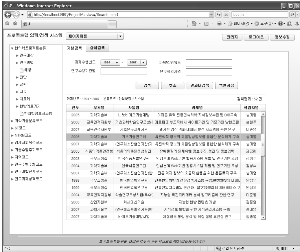
〈그림 3〉 한의학 연구개발과제 검색 시스템의 검색 화면 예제