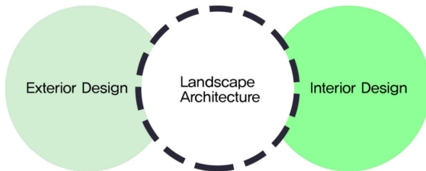
〈그림 2〉 랜드스케이프 건축 다이어그램

둘째, 지역 환경 기반 특화도서관 운영으로 지속 가능한 도서관 환경을 완성해야 한다. 공공도서관은 지역사회 기반시설로서 도서관으로서의 기본 역할과 함께 지역사회의 요구 및 지역 콘텐츠를 기반으로 이용자의 요구를 충족할 수 있도록 서비스해야 한다. 특히, 지속 가능한 운영을 위해서는 공공도서관이 위치한 생태 자연·문화·인구학적 등의 지역 환경을 근거로 도서관 건립과 정보서비스 제공을 통한 특화도서관 운영이 필요하다. (가칭)송대소도서관 건립에 따른 지역 환경과 국내외 사례에서도 지역 환경을 기반으로 특화도서관을 운영하고 있으며, 이를 통해 지역 환경과 연계한 도서관 이용환경 구축으로 지속적인 이용자 유입의 요인이 되고 있다. 따라서 (가칭)송대소도서관 건립의 경우 지역 환경으로서 지질학적 특성을 통한 특화도서관 운영이 요구된다. 이를 통해 한탄강과 주상절리에 대한 자연 환경적 이해와 이용자 요구를 해결해 줄 수 있도록 함으로써 지역 주민과 주상절리