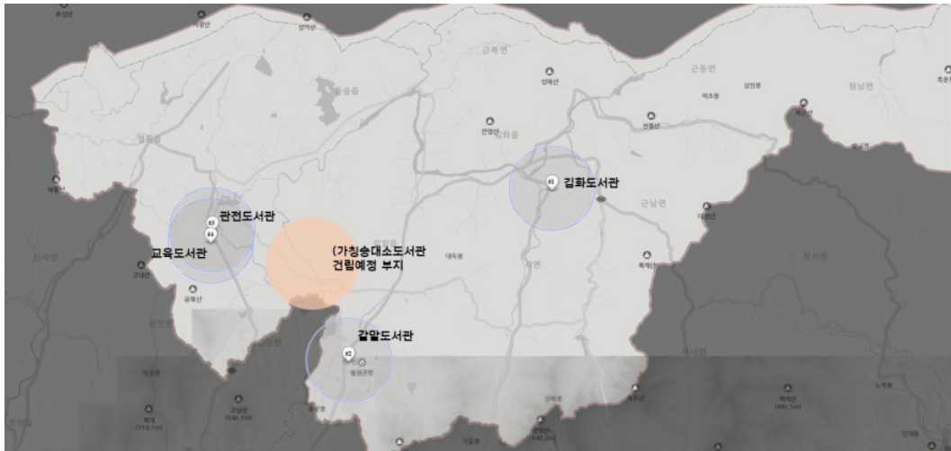
〈그림 1〉 A군 지역 공공도서관 위치