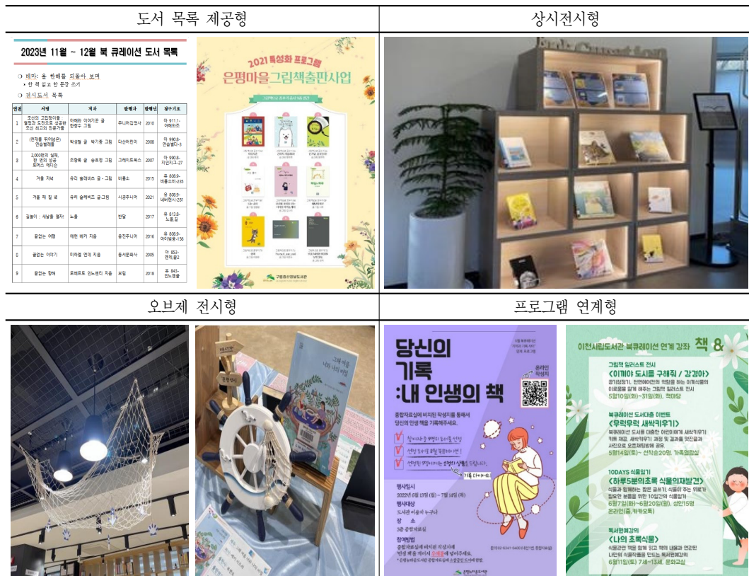
<표 1> 북큐레이션 유형 사례

도서관 북큐레이션 관련 선행연구들은 안은지(2021)에서 제시한 바와 같이 북큐레이션 개