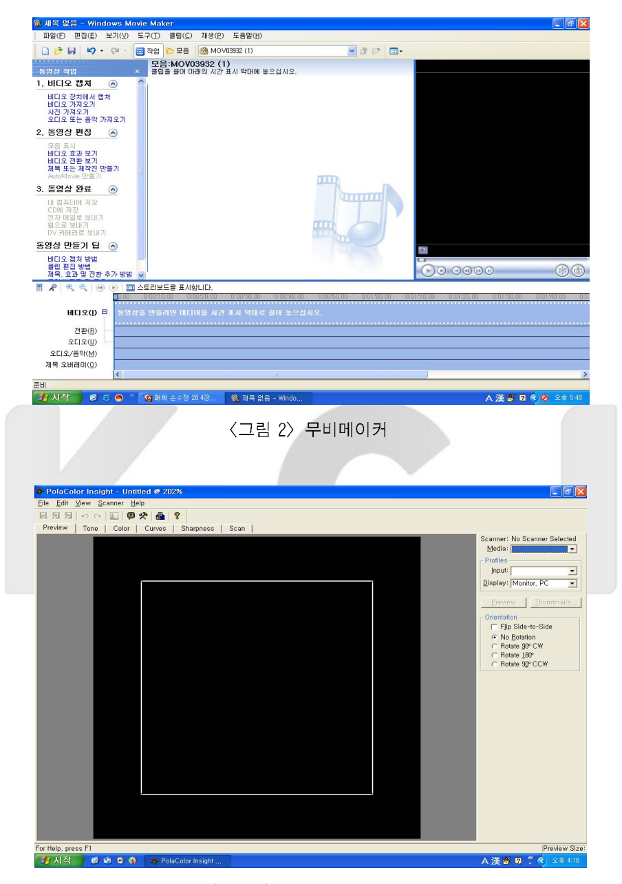
〈그림 3〉 슬라이드 스캐너

제작한 것 같이 보여서 학교도서관에 보관할 때 보기 좋다. CD 겉장 찍기 프로그램은 대부분의 CD를 굽는 프로그램에 포함되어 나온다.