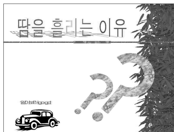
〈그림 4〉 E도서관의 학생 발표물(PPT) 사례

끝나고 발표를 위한 PPT 제작이 일반적으로 이루어지고 있다. 더불어 지도 제작, 신문 제작, 공익광고 제작, 모형제작 등 시간이 많이 소요되지 않는 실물제작을 포함하는 것도 좋다. 교육이 끝난 후에 결과물을 전시하면 학생들의 성취감을 높일 수 있어 정보활용교육의 후속 조치에 대한 참여를 높이고 더불어 정보활용교육의 홍보효과를 가져올 수 있다.