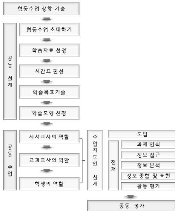
〈그림 2〉 사서교사와 교과교사용 협동수업 설계 전략

이를 위해서는 수업 설계와 운영 및 평가에서 사서교사가 수행하는 정보활용교육이 학습주제와 통합되는 것이 중요하다(송기호 2010, 122). 따라서 수업에 참여하는 교과교사와 사서교사가 공동으로 수업을 설계-운영-평가할 수 있는 구체적인 전략이 필요하다. 본 연구에서는 정보탐색 중심의 도서관활용수업의 한계를 극복하기 위하여 송기호(2010)가 제시한 사서교사와 교과교사용 협동수업 설계 전략(〈그림 2〉 참조)을 국어과와의 협동수업에 적용하였다.