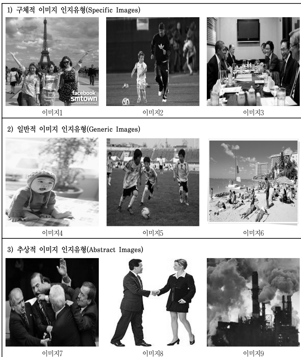
<그림 2> 실험 이미지

형에 따라 제시된 Jaimes and Chang(2000)의 인지모델의 예제를 참고하여 <그림 2>와 같이 구체적 이미지 인지유형 3개, 일반적 이미지 인지유형 3개, 추상적 이미지 인지유형 3개 등 모두 9개의 이미지를 선정하였다.