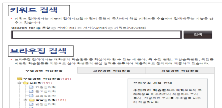
〈그림 2〉 U-CAT의 기본 화면

페이스에 익숙한 대학생들이 브라우징 검색을 생소하게 느낄 가능성이 크기 때문에, 그들에게 익숙한 키워드 검색을 상단으로 배치하였다. 이 연구에서 제안하는 U-CAT의 기본 화면 구성은 〈그림 2〉와 같다.