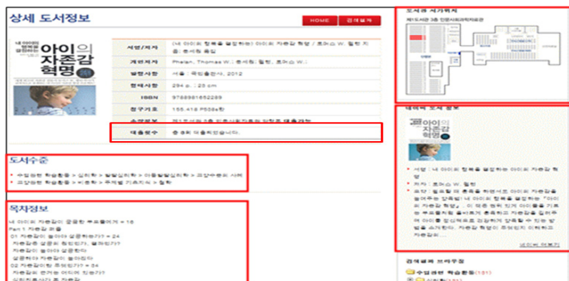
〈그림 4〉 U-CAT의 상세 검색결과 화면