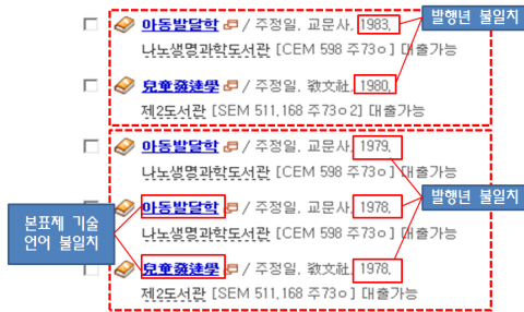
<그림 5> P대학도서관 목록의 간략검색 결과

그렇다면 단위 도서관에서 편목업무를 수행함에 있어 가장 중요한 과제는 무엇일까? 이 질문의 답은 P대학도서관 목록을 살펴보면 쉽게 찾을 수 있다. 가령, P대학도서관 목록에서는 '주정일'이라는 저자가 쓴 『아동발달학』이라는 단행본을 검색하면 <그림 5>와 같이 5건의 검색 결과가 도출된다.