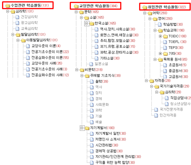
〈그림 1〉 브라우징 검색의 디렉토리 구조