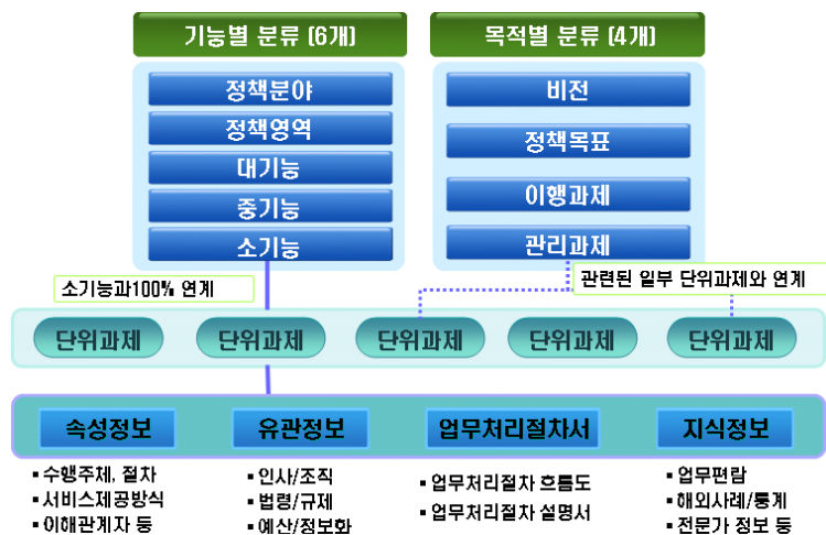
〈그림 1〉 기능분류체계도

행정업무의 추가, 변동, 폐지 등에 따라 기능분류시스템상의 분류체계 내용을 추가, 수정,