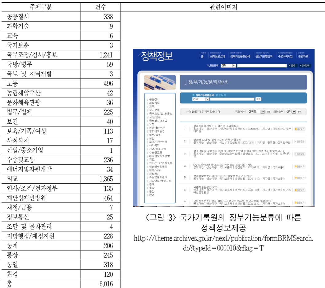
<그림 3> 국가기록원의 정부기능분류에 따른 정책정보제공

http://theme.archives.go.kr/next/publication/formBRMSearch.do?typeId=000010&flag=T