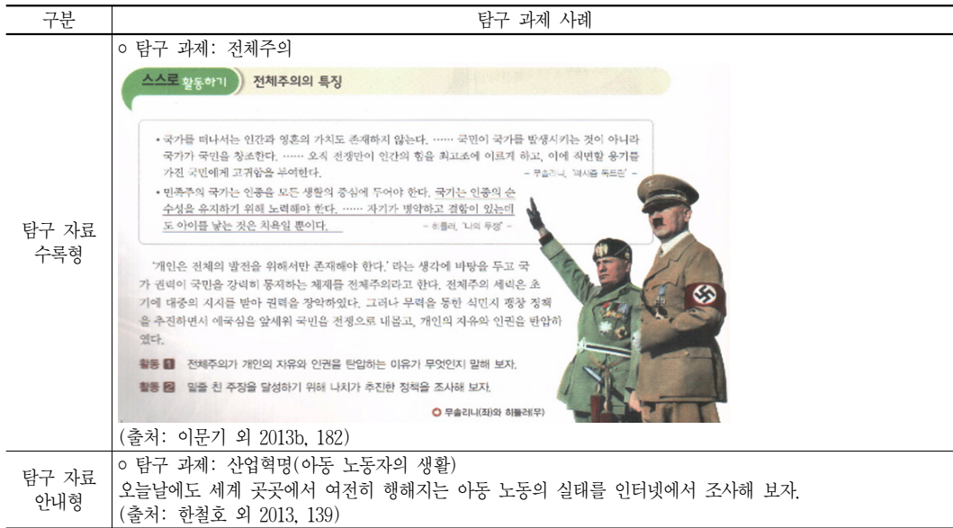
〈표 7〉 중학교 『역사 2』 세계사 영역의 공통 탐구 과제 제시 사례

났다. 탐구 과제 해결 방법은 조사(23회)가 가장 많았으나, 『역사 1』과 달리 특별한 탐구 방법을 포함하고 있지 않은 과제가 절반인 18개에 달했다. 탐구 자료는 본문 수록형 과제인 경우 도서(읽기) 자료(72회), 사진 자료(23회), 지도 자료(17회)순으로 많이 담고 있으며, 탐구 자료 안내형인 경우에는 도서(4회)와 인터넷(4회)을 활용하도록 구성되어 있는 것으로 나타났다. 탐구 결과 표현 방법은 말하기(86회),