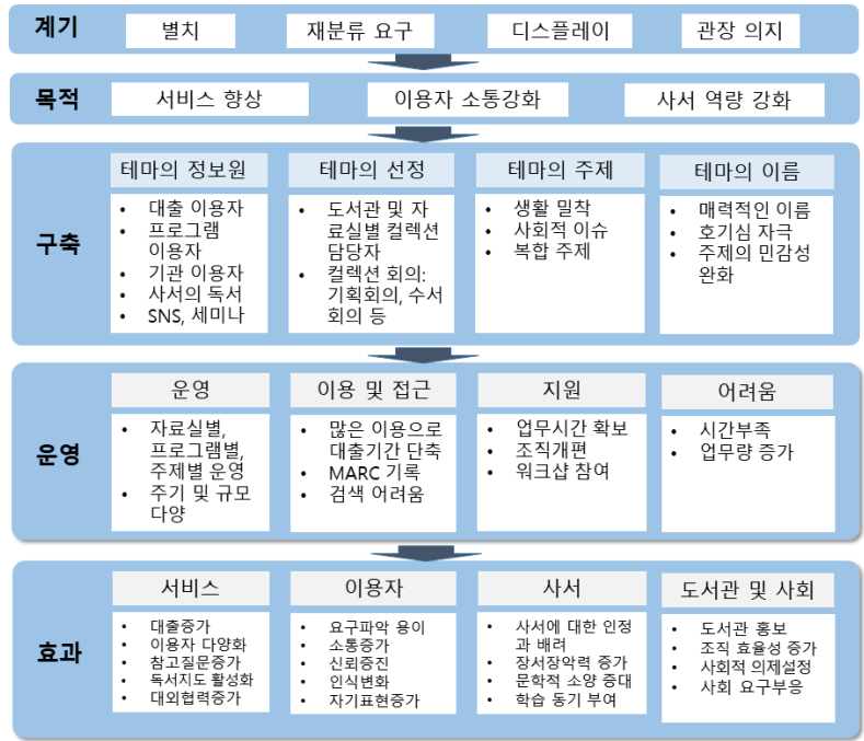
〈그림 3〉 테마 컬렉션 구축과 운영의 현행 모형

으로 시의성을 띤 것이 선택되었으며, 공공도서관 이용자가 부담감이나 거부감 없이 받아들일 수 있는 방식의 이름으로 제공되었다.