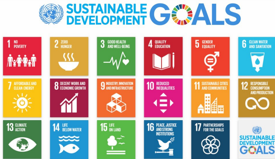
〈그림 2〉 지속가능한 발전을 위한 17개 목표(IFLA 2015)

사람은 없다(no one will be left behind)”라는 주제를 기반으로 선진국과 개발도상국이 하나가 되어 과제에 임하는 것을 지원하는데 주된 목적을 두고 있다. 전 세계의 모든 UN 회원국들은 2016년부터 2030년까지의 15년간 이들 목표를 달성하는데 동의를 하였다. 이 의제는 전 세계가 직면하고 있는 문제를 해결하고 지속가능한 사회를 만들기 위한 것이며, 17개의 개별적인 목표는 상호간에 유기적인 관계를 이루고 있다. 이 목표 달성을 위해서는 개발도상국, 선진국을 막론하고 국가와 기업, 시민사회 등 다양한 이해관계자가 함께 역할을 해 나가는 것이 중요하다는 것을 지역공동체가 인식하는 것이 중요한 의미를 지니고 있다.